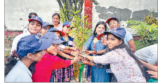
सोनीपत। कार्यक्रम के दौरान पौधारोपण करती छात्राएं।