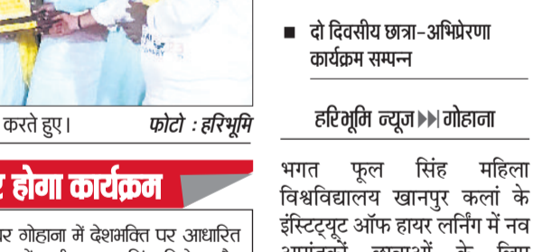
गोहाना। कार्यक्रम में मौजूद छात्राएं व स्टाफ।