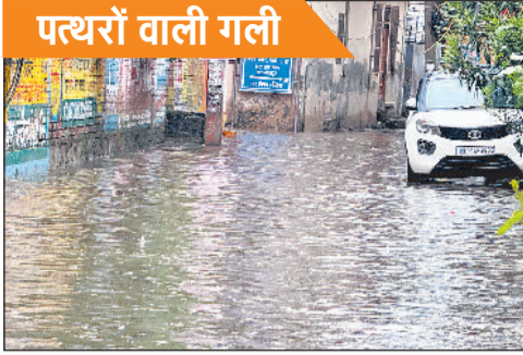
पत्थरों वाली गली

सोनीपत में लगातार दूसरे दिन भी बारिश की वजह से जनजीवन अस्त-व्यस्त रहा। मंगलवार को सुबह के समय बारिश हुई थी, लेकिन कुछ देर बाद रुक गई। वहीं दोपहर बाद शुरू हुई बारिश देर शाम तक लगातार जारी रही। जिसके कारण शहर की सड़कें व गलियां एक बार फिर तालाब बनीं रहीं। लगातार हुई वर्षा ने एक बार फिर निकासी व्यवस्था की कमी खोल दी, जलभराव ने आमजन की मुश्किलें भी बढ़ा दीं। मुख्य चौक-चौराहों से लेकर कालोनियों तक सड़कों ने तालाब का रूप ले लिया। सबसे अधिक परेशानी शनि मंदिर अंडरपास में पानी भरने से हुई, जिससे शहर दो हिस्सों में बंटा रहा। वहीं वर्षा से तापमान में गिरावट दर्ज की गई है। जिले में औसत 56 एमएम बारिश दर्ज की गई। इसमें सबसे अधिक बारिश राई ब्लॉक में 89 एमएम तो सोनीपत में 87 एमएम बारिश दर्ज की गई है।