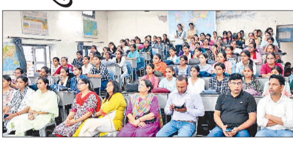
गोहाना। कार्यक्रम में मौजूद छात्राएं व स्टाफ।