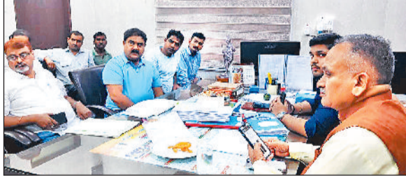
सोनीपत। बैठक के दौरान उपस्थित एस्सेसरीज दुकानदार साथ में मेयर एवं निगम आयुक्त।