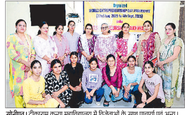
सोनीपत। टीकाराम कन्या महाविद्यालय में विजेताओं के साथ प्राचार्या एवं अन्य।