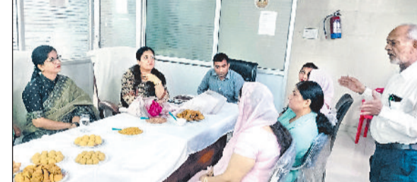
गोहाना। बैठक में अपनी बात रखते हुए नगर पार्षद।